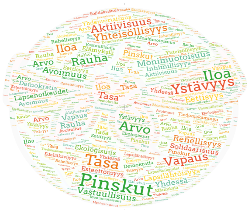
Kuva 1. Pinskujen arvomaapallo.